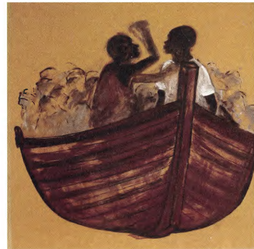
10. Station: Auf den Booten ist man der Willkür der Schleuser ausgeliefert – Jesus wird seinen Kleidern beraubt.